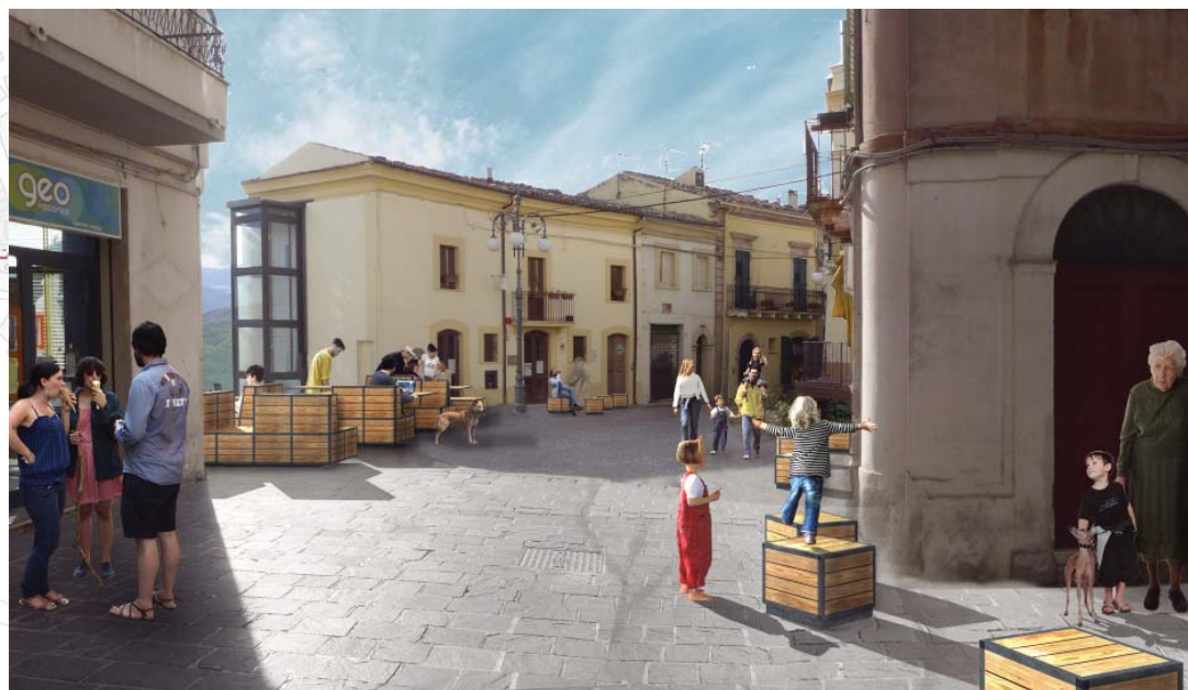
Concorso di idee per l'arredo urbano del percorso storico di Atesa (CH)