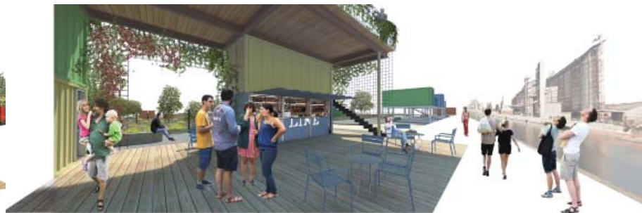
PRIMO PREMIO - Concorso di idee sul riuso di un'area in Darsena a Ravenna