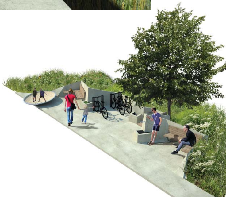
Concorso di idee per la riqualificazione urbana della via Livornese Est. Perignano (PI)